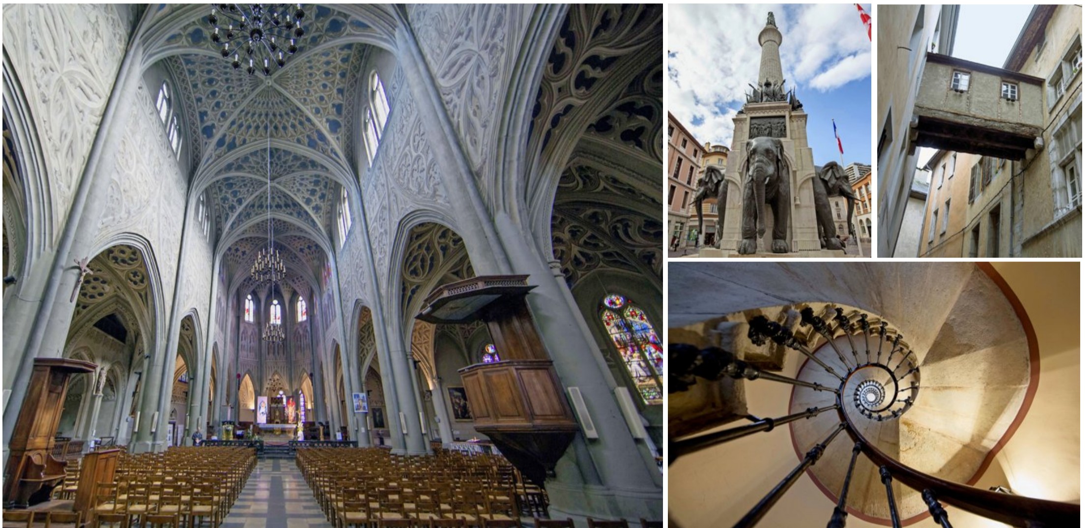
De la cathédrale à la Fontaine des Éléphants, en passant par l'étonnante architecture de la ville, Chambéry propose bien des points d'intérêt...